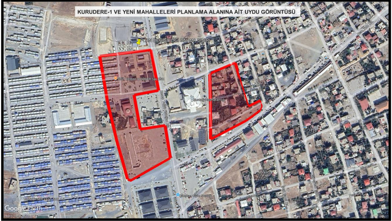
Şekil 1: Planlama Alanına Ait Uydu Görüntüsü

Planlama alanına ait uydu görüntüsü aşağıda gösterilmiştir.