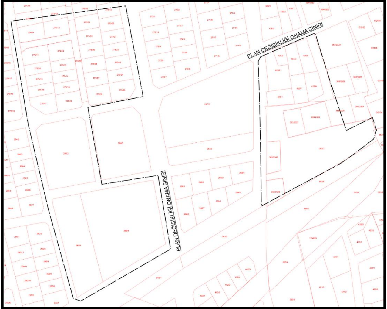
Şekil 2: Planlama Alanına Ait Kadastro Planı