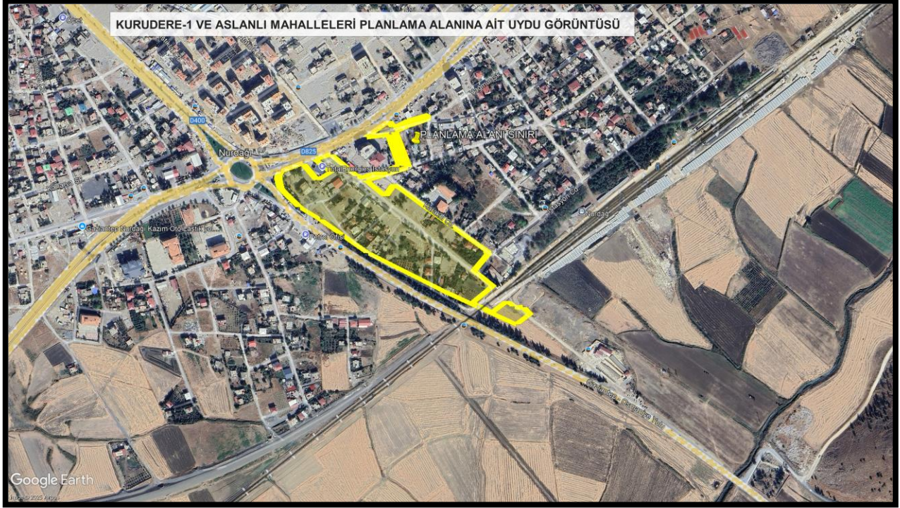
Şekil 1: Planlama Alanına Ait Uydu Görüntüsü

Planlama alanına ait uydu görüntüsü aşağıda gösterilmiştir.