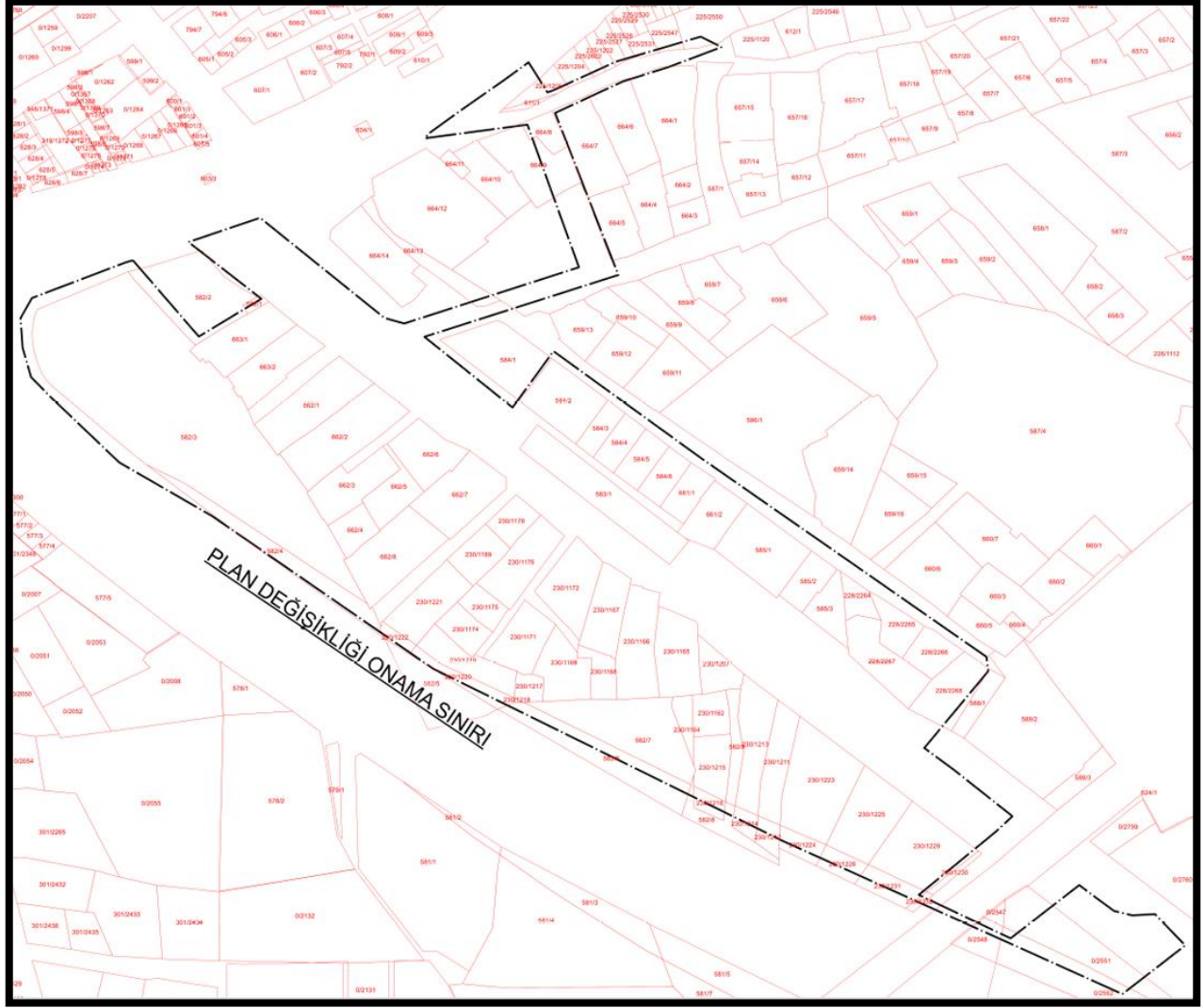
Şekil 2: Planlama Alanına Ait Kadastro Planı