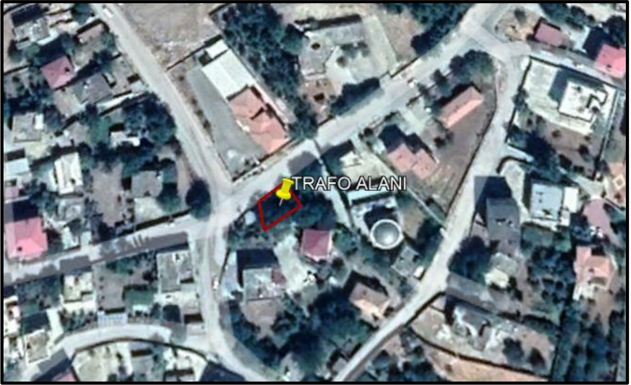
Şekil 1. İmar Plan Deęişikliğine Konu Olan Alana Ait Uydu Görüntüsü

Planlamaya konu olan trafo alanı Şatırhüyük Mahallesi içerisinde Adana-Şanlıurfa Otoyolunun güneyinde Gaziantep-Osmaniye Yolunun kuzeyinde yer almaktadır.